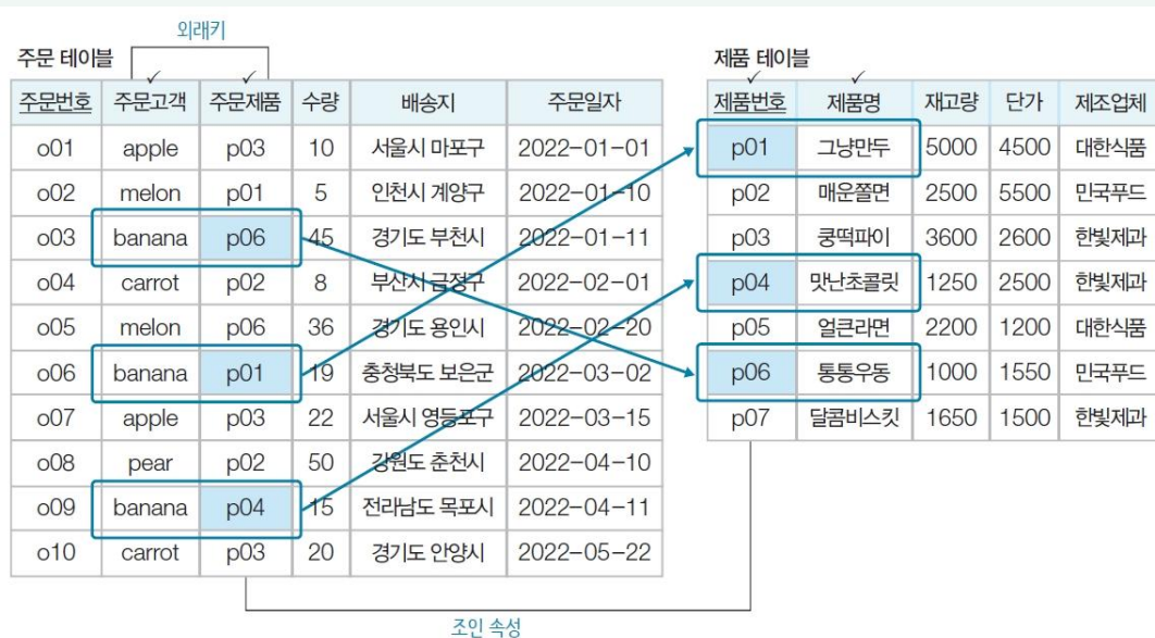
그림 7-11 2개의 테이블을 이용한 조인 검색 예: 주문 테이블과 제품 테이블

조인 속성의 이름은 달라도 되지만 도메인은 반드시 같아야 함 (외래키를 조인 속성으로 활용)